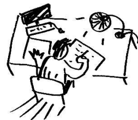
illustration et mise en forme